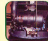
सुख्खा एअर फिल्टर