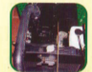
ओभरफ्लो रिजर्भवायर साथमा रेडीएटर