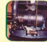
सुख्खा एअर फिल्टर