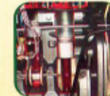
पिस्टन कुलिङ्गको लागी आयल जेट