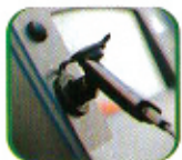
होल्डर सहित मोबाइल चार्जिङ्ग प्वाइन्ट