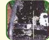
Radiator with Overflow Reservoir