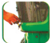
सिक्वल पिस हड को साथमा हड लक