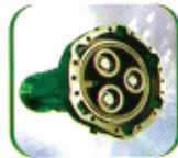
प्लानेटरी गियर स्ट्रेट एक्सल को साथमा