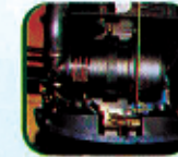
सुसुखा एअर फिल्टर