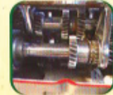
टप साफ्ट लुब्रिकेशन