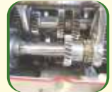
Top Shaft Lubrication