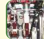
Oil Jet for Piston Cooling