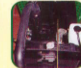
ओभरफ्लो रिजर्भवायर साथमा रेडीएटर