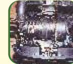
Dry Type Air Filter