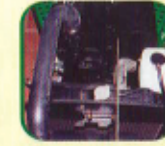
ओभरफ्लो रिजर्भवायर साथमा रेडीएटर