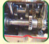
टप साफ्ट लुब्रिकेशन