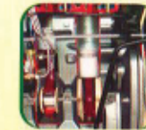
पिस्टन कुलिङ्गको लागी आयल जेट