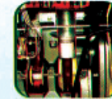
पिस्टन कुलिङ्गको लागि आयल जेट