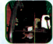
ओभरपलो रिजर्भायर साथमा रेडीएटर